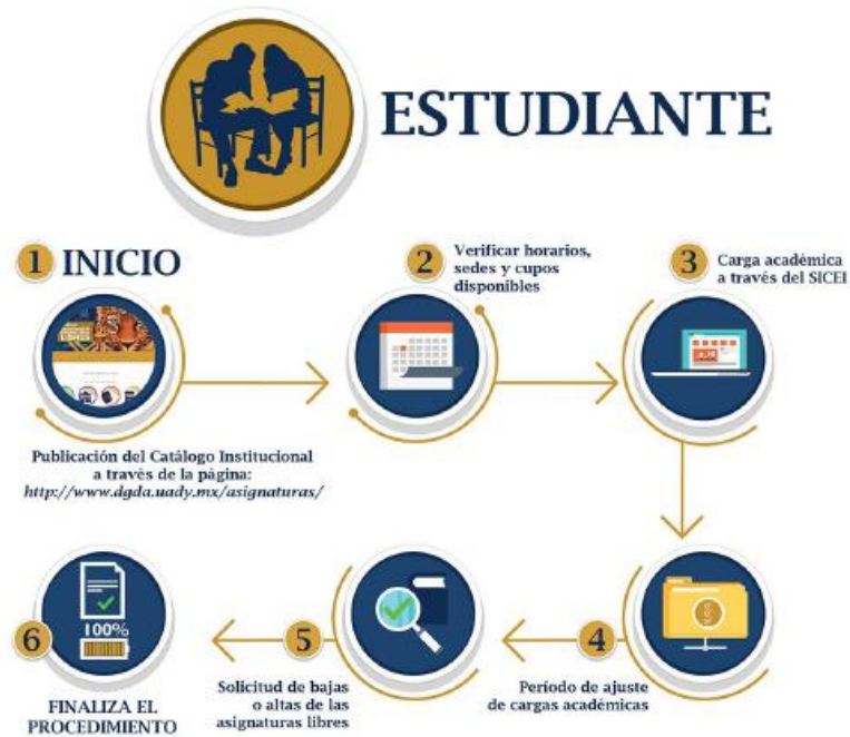
DIAGRAMA DEL PROCEDIMIENTO DE INSCRIPCIÓN A LAS ASIGNATURAS LIBRES DEL CATÁLOGO INSTITUCIONAL