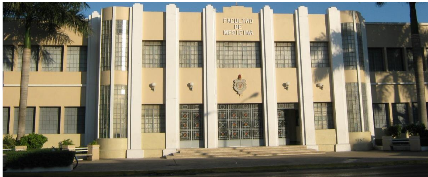
Entrada de la Facultad de Medicina.

Guía para la solicitud de dictamen FMED-UADY para borrador de tesis o artículo científico.